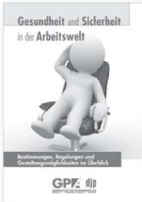
Gesundheit und Sicherheit in der Arbeitswelt